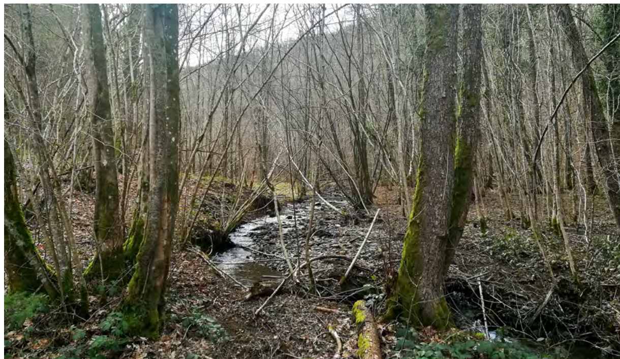
↑ Forêt de Régniessart, Parc national de l'Entre et Sambre et Meuse

Le Parc National de la vallée du Semois s'étend sur 28 900 ha et de nombreuses communes engagées, dont 86 % de milieux forestiers, principalement des forêts de pentes le long de la vallée de la Semois, une des rivières les plus sauvages de Wallonie. Le projet prévoit également une forte augmentation des surfaces forestières en libre évolution vers 10 % des forêts