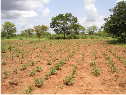
Burkina Faso - Tolotama Reforestation