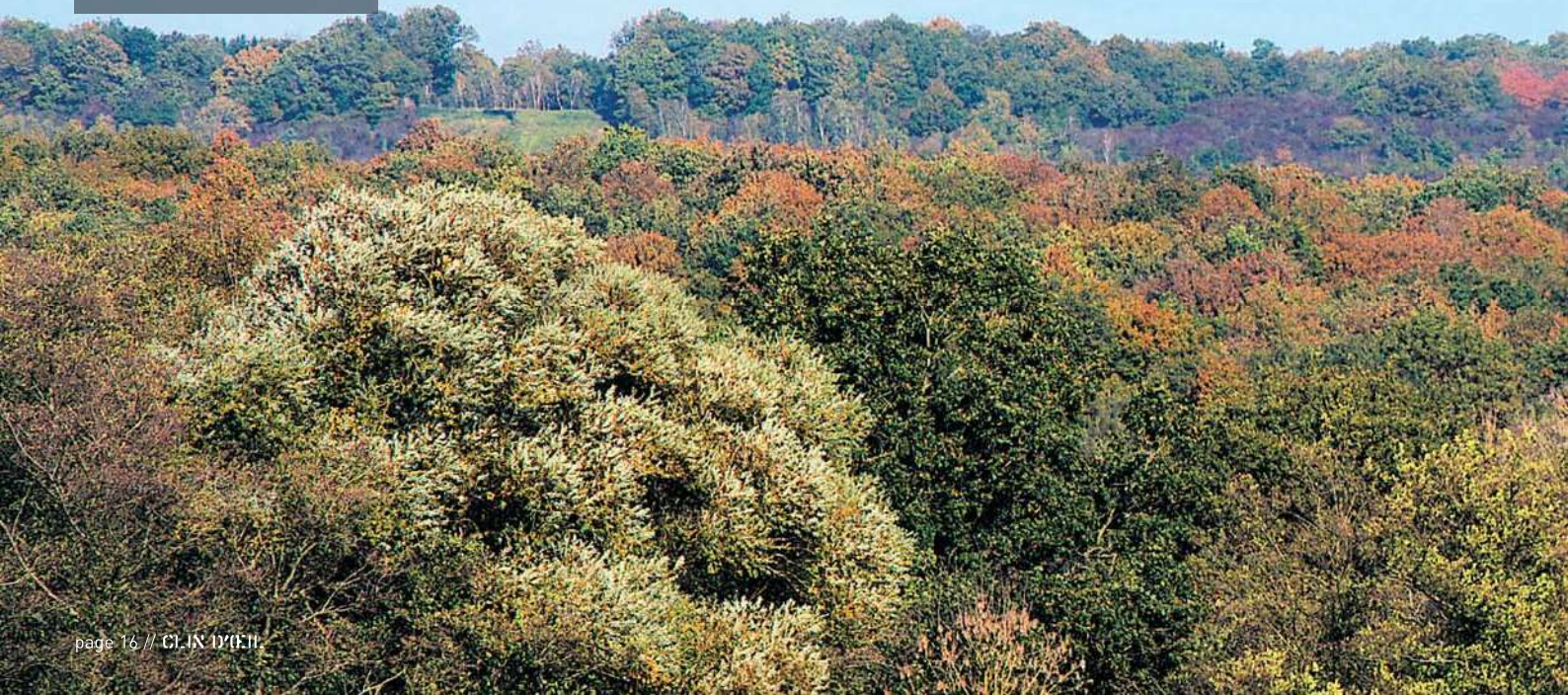
Forêt de Fagne