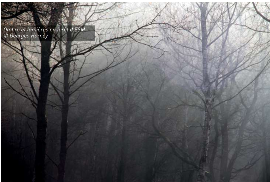
Ombre et lumières en forêt d'ESM

neux en forêt communale (on passerait de 18% actuellement à 25% dans la décennie à venir). La transformation de forêts feuillues en résineux n'est pas un acte anodin, elle réduit immédiatement la valeur biologique de la parcelle, et bouleverse irrémédiablement son écologie sur le long terme. Et même si le pourcentage de surface concerné peut sembler faible, le risque est également que cette conversion s'opère au détriment des forêts actuelles qui présentent la plus grande valeur écologique.