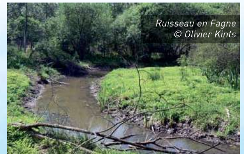
Ruisseau en Fagne

Le besoin d'une sylviculture plus proche de la nature. Bien que l'attention en la matière et l'évolution des mentalités progressent, il reste des efforts à faire pour améliorer l'état écologique de nos forêts. Par exemple, en ce qui concerne le déficit en bois mort. Certes en parcourant nos bois, nous observons de petites branches mortes et l'un ou l'autre tronc pourrissant ; mieux encore des chandelles, des arbres morts, des arbres à loges (de pics) sont marqués et préservés au nom de la biodiversité. Mais les forêts naturelles comptent jusqu'à 10 fois plus de bois mort que nos forêts gérées ! De manière générale, une sylviculture plus proche de la nature devrait être développée et universellement adoptée.