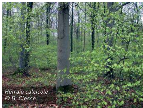
Hêtraie calcicole

LES HÊTRAIES CALCICOLES. Il fut un temps où la Calestienne était couverte de forêts, avant les défrichages qui se sont étalés du Néolithique et jusqu'à bien après le Moyen-Âge. Pendant quelques siècles, le paysage y laissait surtout à voir des pâturages extensifs dont les dernières reliques sont les fameuses pelouses calcaires qui font la fierté naturaliste de la région. Sur ces roches calcaires, les forêts étaient essentiellement dominées par le hêtre.