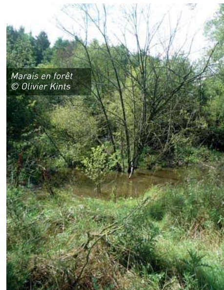
Marais en forêt