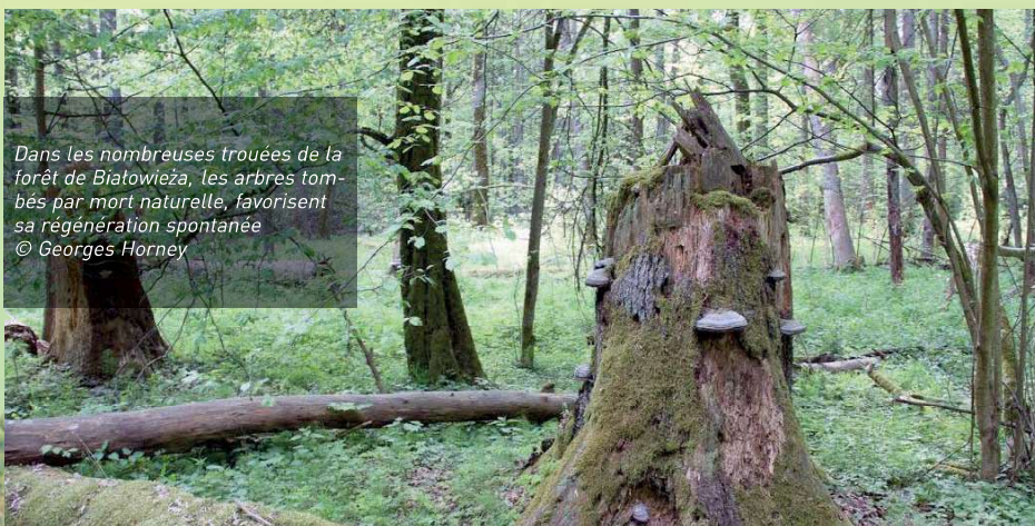
Dans les nombreuses trouées de la forêt de Białowieża, les arbres tombés par mort naturelle, favorisent sa régénération spontanée