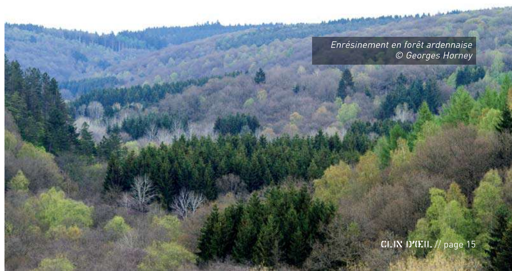
Enrésinement en forêt ardennaise

L'ENRÉSINEMENT. Dans notre région, la culture de résineux est déjà largement dominante dans les propriétés privées. La conjoncture économique incite malheureusement les propriétaires à s'enfoncer plus encore dans cette voie... Et les garde-fous prévus par la législation pour éviter la transformation massive de forêts feuillues en cultures résineuses sont trop facilement contournés. Les forêts publiques sont également menacées... A Viroinval, par exemple, un nouveau plan d'aménagement, porté par la commune et le cantonnement, prévoit l'augmentation des surfaces de rési-