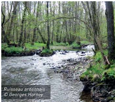
Ruisseau ardennais

nomie forestière, où les intérêts d'une petite poignée de méga-scieries de résineux incitent à une augmentation des cultures d'épicéas.